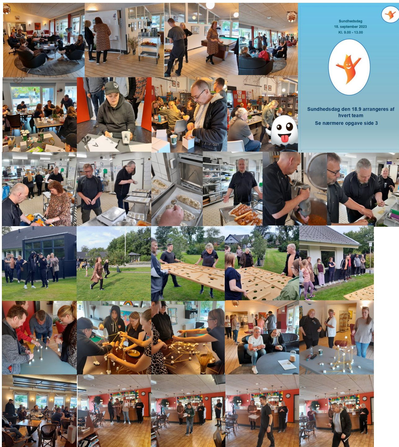
Billeder fra sidste Sundhedsdag den 18. september 2023