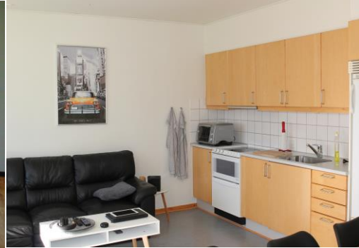
Stue/ køkken i almen bolig §105