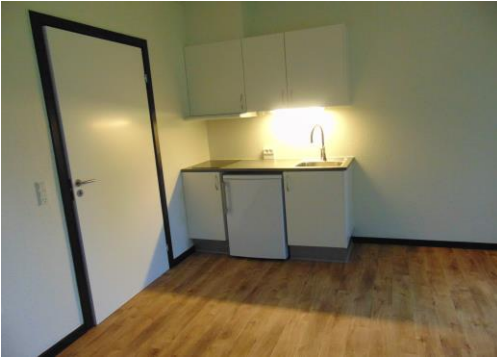
Stue / tekøkken i en bolig §§107,108