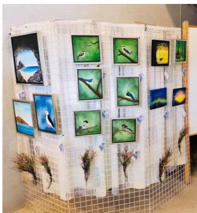
De kreative værker.

Der udfærdiges statusbeskrivelser / evaluering en gang årligt eller efter behov med udgangspunkt i ovenstående.