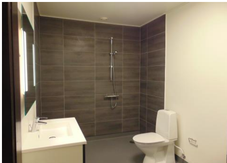
Nyrenoveret badeværelse i en bolig §§107,108