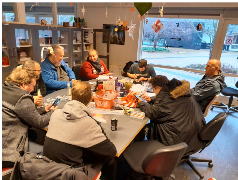
Fælles krea-hygge i Kreativ.