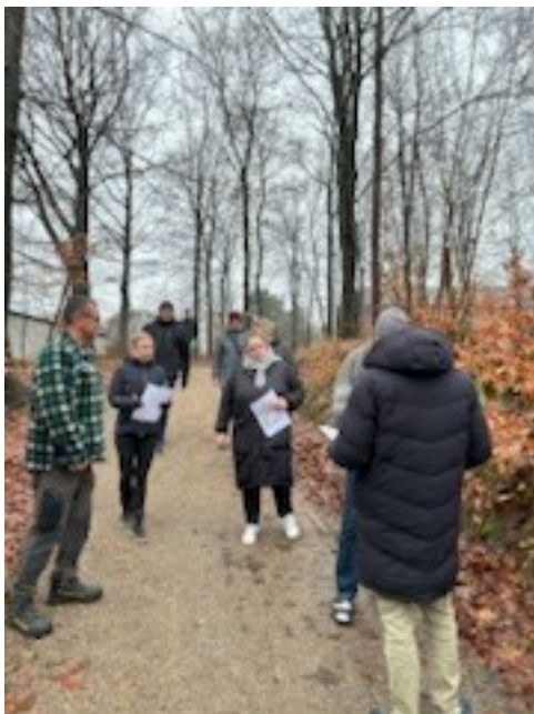
Nissebanko i anlægget